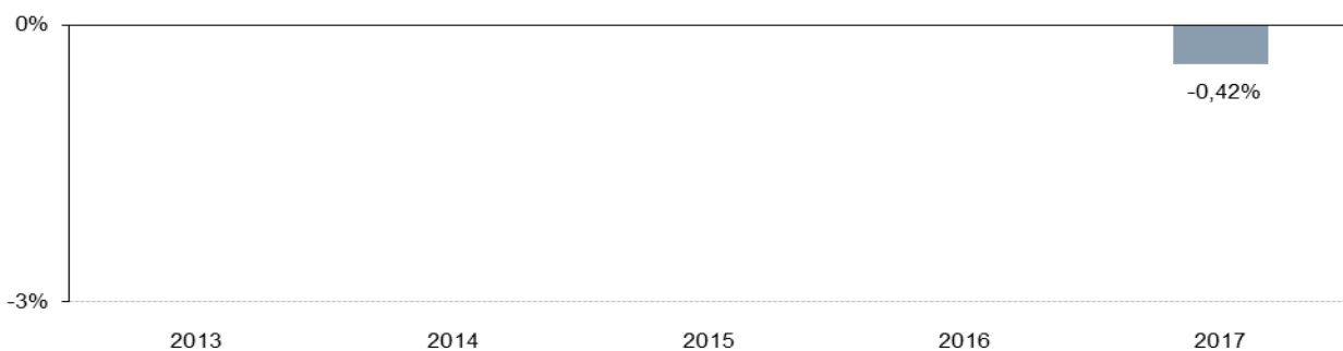
Apollo Mündel (A3)

Die Wertentwicklung in der Vergangenheit lässt keine Rückschlüsse auf die künftige Entwicklung zu. Der Fonds wurde am 07.01.1994 aufgelegt, die hier angegebene Tranche wurde per 27.09.2016 aufgelegt.